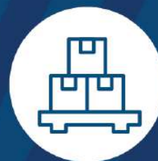
biblioteca de objetos