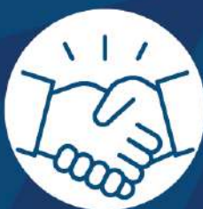
salas de reuniones