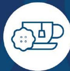
casa de té