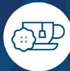
casa de té